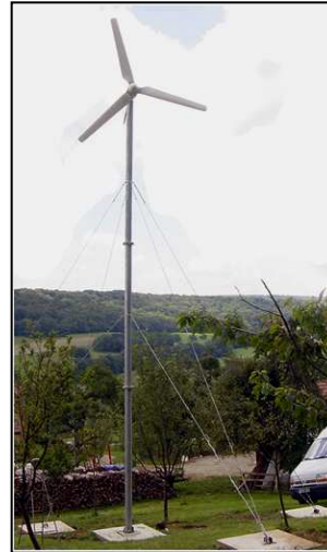
Éolienne 2 kW sur mât tubulaire haubané

*Donnée indicative simulée d'après courbe constructeur avec un vent moyen de 6 m/s mesuré à 10 m de haut